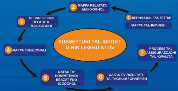
L-Istrategija ta' Tagħlim Tul il-Ħajja għas-settur tal-Isport u Hfin Liberu Attiv (EOSE, 2009)

L-iżvilupp ta' standards relatati max-xogħol qed jitmexxa mill-industrija u l-kontenut jispeċifika l-istandards ta' prestazzjoni li l-persuni huma mistennija jilhqu fix-xogħol tagħhom, u l-għarfien u ħiliet li jeħtieġu jwettqu b'mod effettiv. Fi kliem ieħor, l-istandards jiddefinixxu l-kompetenzi, ħiliet u għarfien meħtieġa għax-xogħlijiet fis-settur.